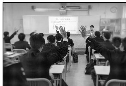
<デートDV予防学習会風景>